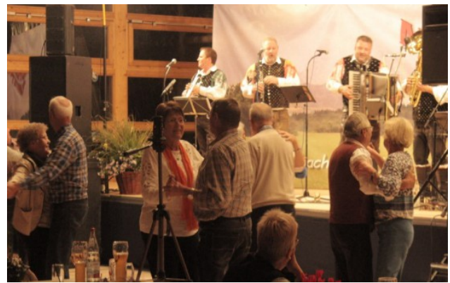
Tanz zur Musik des Mühlbach-Quintetts.

Weitere Bilder auf der Homepage: www. miteinander-frickingen.de