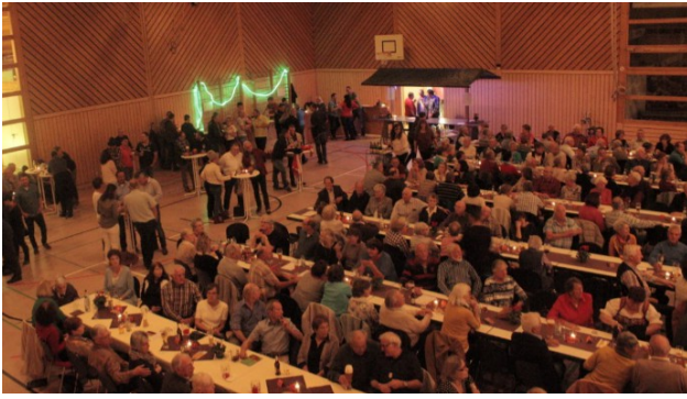
An der Weizenbar war`s auch nett.