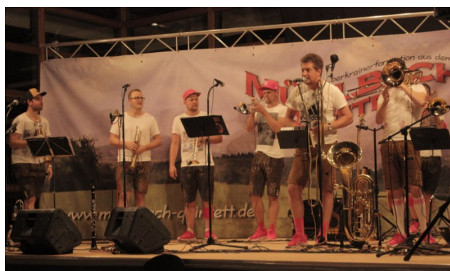
Jack Russels Halsbänd brachte auch zu später Stunde noch tolle Stimmung.